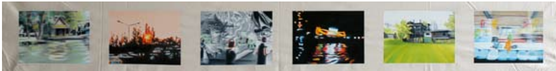
En route 2010 Huile sur toile 38 x 180 cm